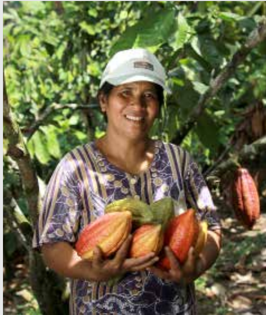
Buah-buah Kakao terbaik Indonesia berasal dari kebun-kebun petani dari Kabupaten Mamuju, Sulawesi Barat.

mengukur stok dan jejak karbon di perkebunan kakao, SCPP akan dapat mengukur dampaknya sehingga memberikan kontribusi pada pengurangan emisi gas rumah kaca di sektor kakao.