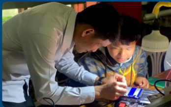
Image: Equivalency Programme in Electrical Installation at IVET college in Oudomxay