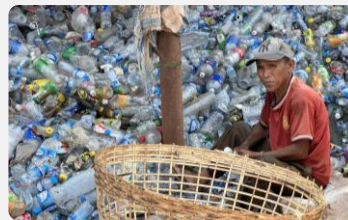
ຮູບພາບ: ຜູ້ເກັບຂີ້ເຫຍື້ອຢູ່ສະໜາມຂີ້ເຫຍື້ອຫຼັກ 32