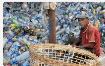
Image: Informal waste picker at the Km32 landfill