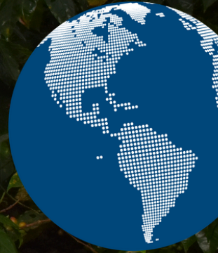
Proyecto Café Inclusivo, Honduras.