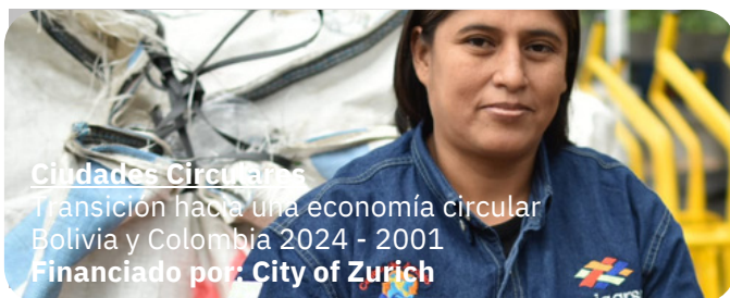
Ciudades Circulares Transición hacia una economía circular Bolivia y Colombia 2024 - 2031 Financiado por: City of Zurich

Fortalecimiento a mujeres productoras de café en situación de vulnerabilidad mediante apoyo psicosocial, asistencia técnica con enfoque de género y una gestión agrícola mejorada, garantizando su bienestar y su resiliencia económica.