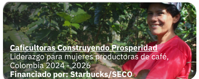
Caficultoras Construyendo Prosperidad Liderazgo para mujeres productoras de café, Colombia 2024 - 2026 Financiado por: Starbucks/SECO

Impulsar una transformación cultural en las comunidades cafeteras mediante la formación de productores en derechos humanos, prevención del trabajo infantil y empoderamiento económico de las mujeres, promoviendo entornos más inclusivos y sostenibles.