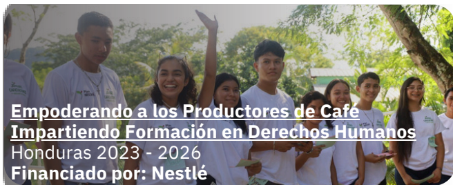
Empoderando a los Productores de Café Impartiendo Formación en Derechos Humanos Honduras 2023 - 2026 Financiado por: Nestlé

Proyecto Ciudades Circulares, Bolivia & Colombia.