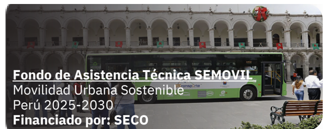
Fondo de Asistencia Técnica SEMOVIL Movilidad Urbana Sostenible Perú 2025-2030 Financiado por: SECO

Impulsar una gestión de residuos circular y sostenible que aumente el reciclaje, reduzca la contaminación y el uso de materias primas vírgenes, y mejore las condiciones laborales y la dignidad de los recicladores.