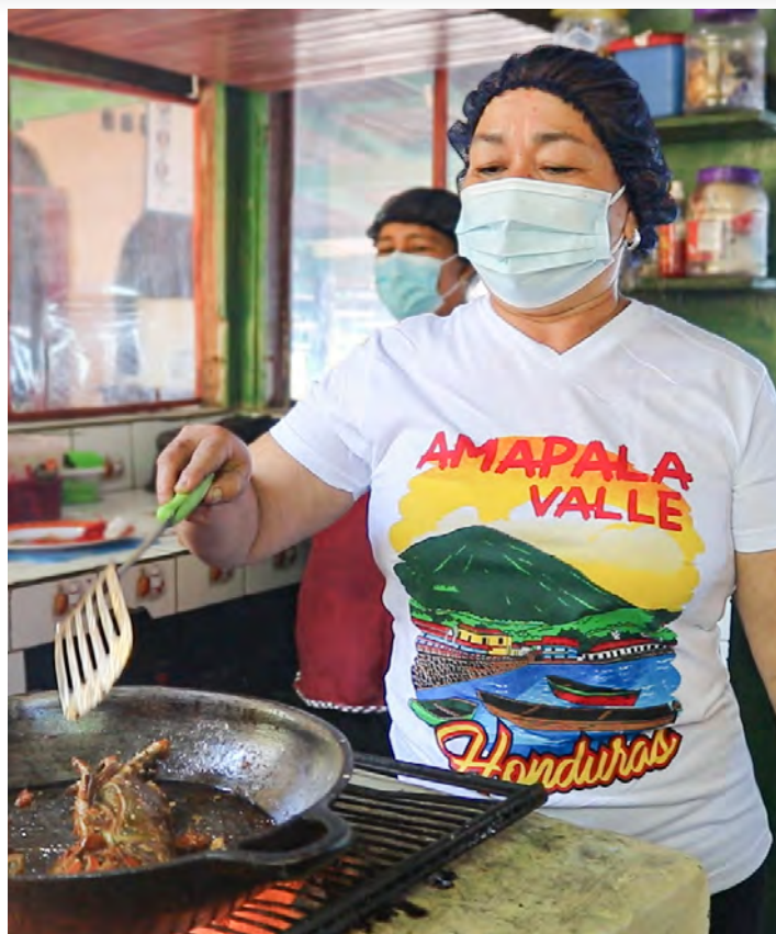
Con la certificación SICCS las MIPYME del rubro turístico aumentan su competitividad, al formar parte de la red centroamericana de operadores turísticos.

La certificación, dará a las empresas el respaldo de implementación del sistema de calidad en sus procesos y a su vez, contribuirá a que las empresas sean más rentables y competitivas.