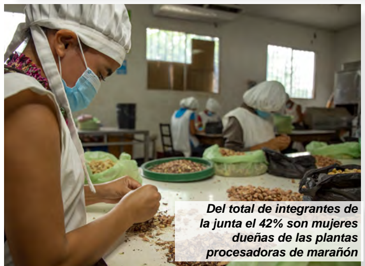
Del total de integrantes de la junta el 42% son mujeres dueñas de las plantas procesadoras de marañón