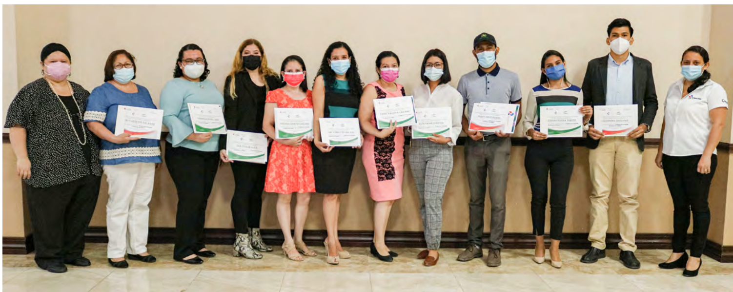
Participantes de la formación de "Gestores de calidad" en su graduación

Con las competencias creadas, hombres y mujeres jóvenes tienen más oportunidades para insertarse al mercado laboral y a su vez, estandarizar procesos de calidad en la oferta de servicios.