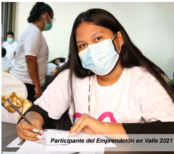
Participante del Emprendetón en Valle 2021

continúa fortaleciendo capacidades productivas y empresariales para la mejora del bienestar económico de las personas, las familias y las comunidades de la región Golfo de Fonseca.