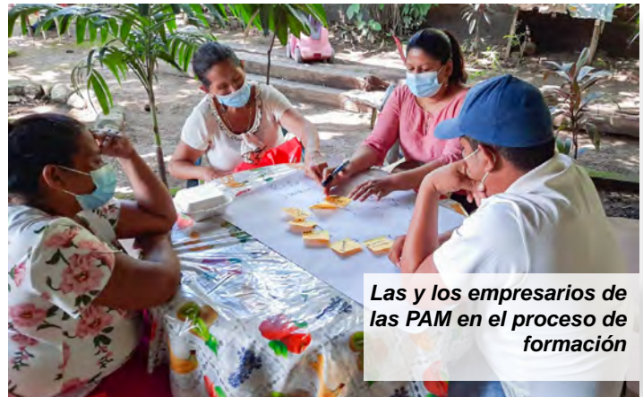
Las y los empresarios de las PAM en el proceso de formación

Con una marca colectiva con propósito claro, una estructura organizativa que le respalda y las mejoras realizadas en las plantas, las empresarias y empresarios del rubro asegurarán una mayor calidad en sus procesos y productos, que a su vez contribuirá a la formalización de sus operaciones y les permitirá crear mejores oportunidades de comercialización.